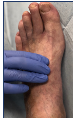
डोरसालिस पेडिस धमनी