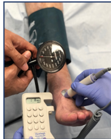
ऐड़ी की सिस्टोलिक दबाव