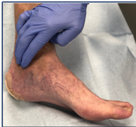
पोस्टीरियर टिबियल नाड़ी परीक्षा

धमनी विशेषज्ञ (Vascular Surgeon) को दिखाना जरूरी है